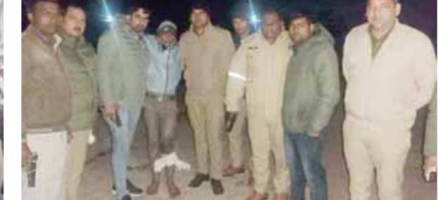
ग्रेटर नोएडा में तीन साल की मासूम बच्ची के साथ दुष्कर्म की सूचना से आक्रोशित लोग थाने पर प्रदर्शन करते हुए। वहीं पुलिस मुठभेड़ में घायल आरोपी।

बता दें कि कि बीती शाम रबुपुरा क्षेत्र के चामुंडा मंदिर मोड़ के पास एक खेत में एक बच्ची नग्न अवस्था में खड़ी रो रही थी। बच्ची लहूलुहान और बदहवास हालत में थी।