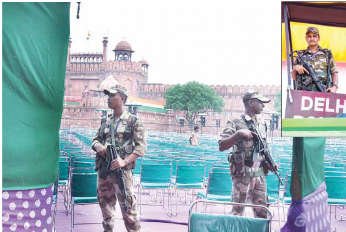
प्रधानमंत्री नरेन्द्र मोदी बृहस्पतिवार को स्वतंत्रता दिवस समारोह में 11वीं बार राष्ट्रीय ध्वज फहराएंगे। सुरक्षा के मुद्देनजर यहां सुरक्षा कड़ी है।

समारोह स्थल पर स्नाइपर और 2000 से ज्यादा सीसीटीवी की रहेगी नजर