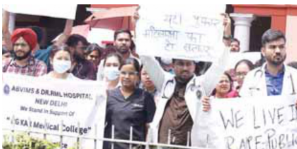
अस्पतालों में सुरक्षा की मांग को लेकर प्रदर्शन करते आरएमएल के चिकित्सक।

भारतीय चिकित्सा संघ (एफओआईएमए) ने विभिन्न रण्यों और राष्ट्रीय महत्व के संस्थानों के आरडीए के साथ बैठक के बाद एक बयान में कहा कि वह देश भर के अपने साथियों के साथ घटना की निंदा करता है और अपनी हड़ताल जारी रखेगा। हालांकि फेडरेशन ऑफ रेजिडेंट डॉक्टर्स एसोसिएशन (एफओआईएमए) ने केंद्रीय स्वास्थ्य मंत्री जे. पी. नड्डा के साथ उनके अनावस पर हुई बैठक के बाद अपनी हड़ताल वापस ले ली। एसोसिएशन ने कहा कि हड़ताल समाप्त करने का निर्णय मरीजों के कल्याण को ध्यान में रखकर लिया गया है।